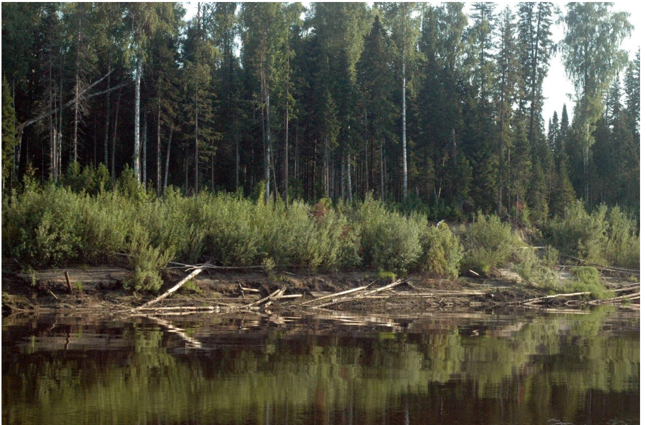
Фото 3. Корчи вдоль обрывистых берегов.