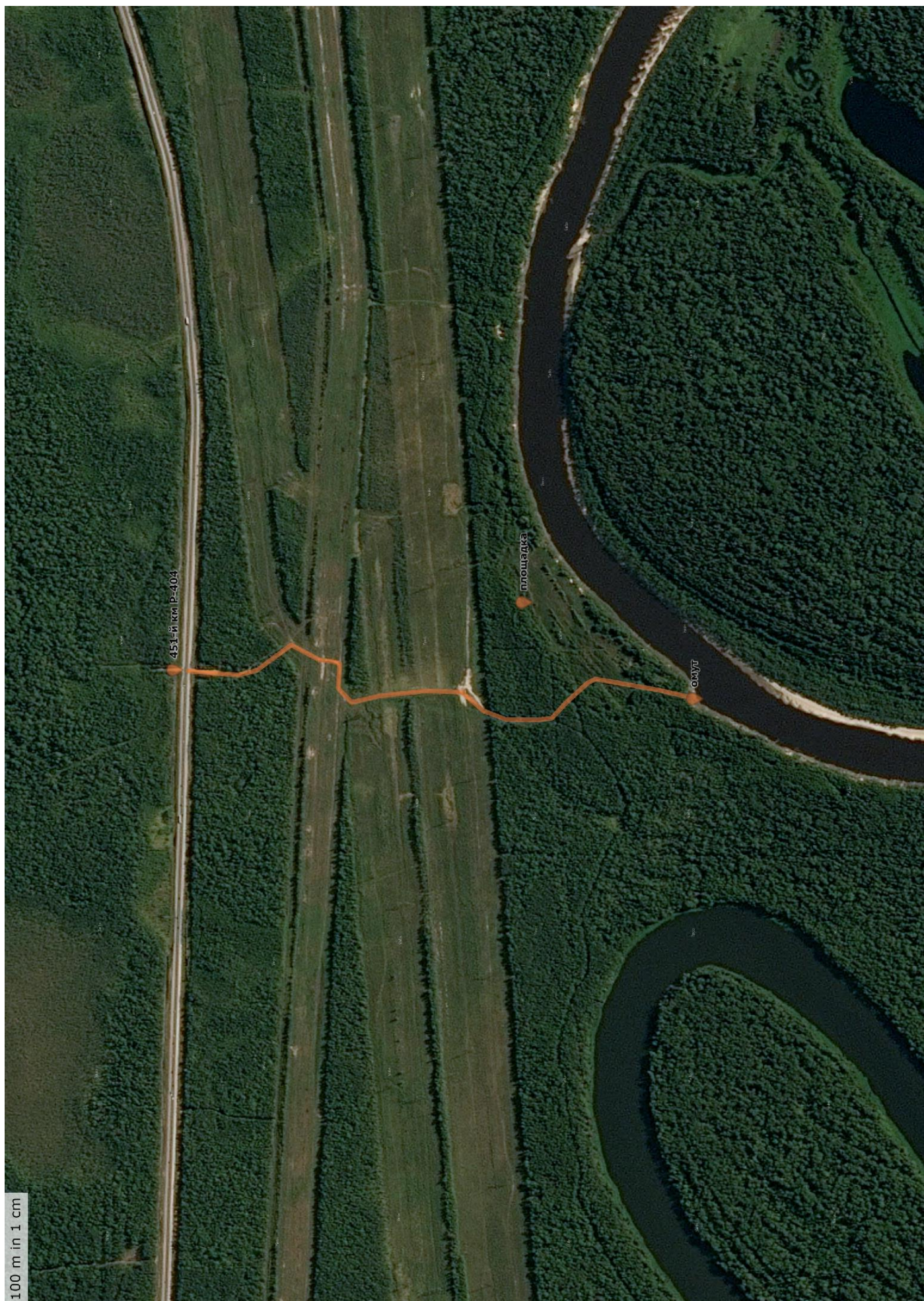
Фото 13. Аварийный выход пешим ходом по грунтовой малопосещаемой дороге на 451-й км Р-404. Протяженность 1,2 км.