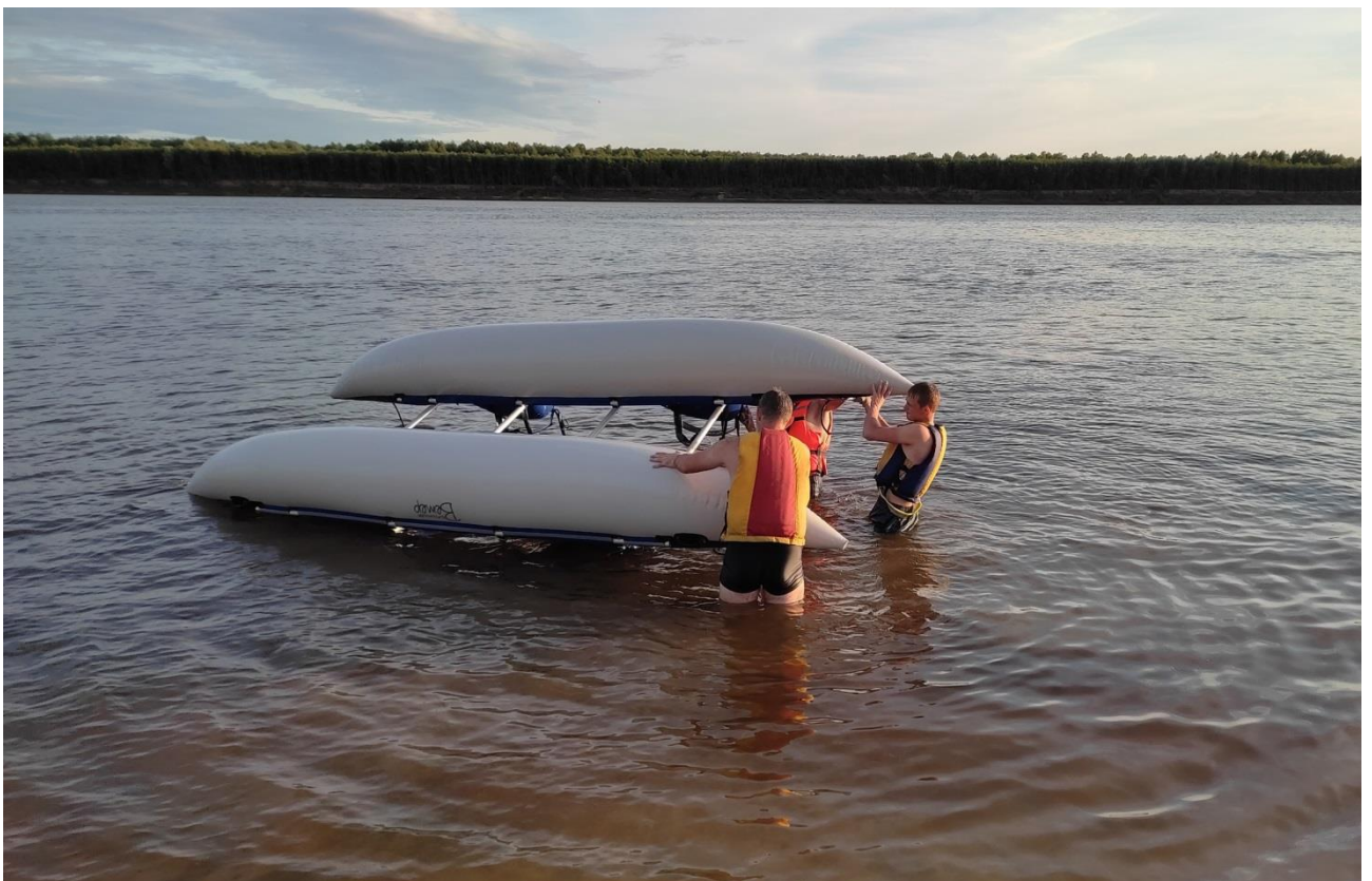
Фото 11. Помывка судов и другого снаряжения на финише у пристани с.Демьянское.