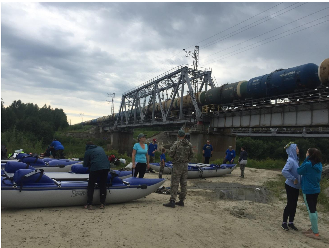
Фото 1. Площадка для стапеля возле ж.д.моста.