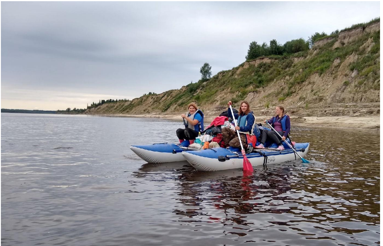
Фото 10. Заключительный 7 км участок проходит по р.Иртыш.