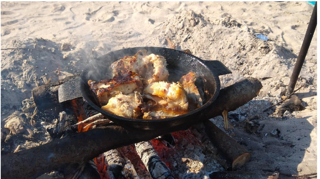
Фото 6. Пищевой рацион можно пополнить свежей выловленной рыбой.