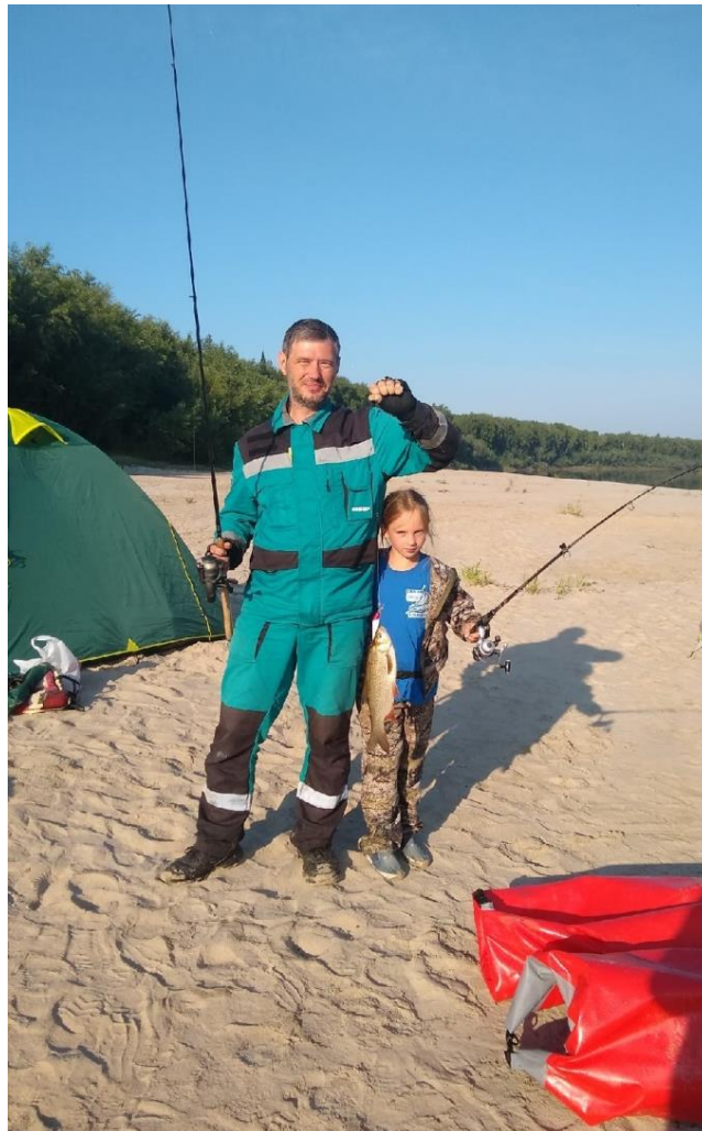
Фото 7, 8. Очень хорошо на блесну ловится щука, на поплавочную удочку язь.