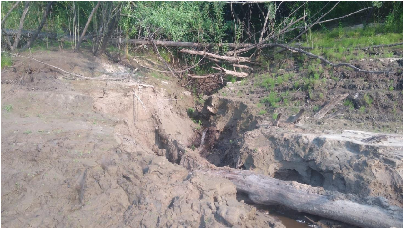
Фото 5. В реку впадает много мелких речек, ручейков и даже есть родники.