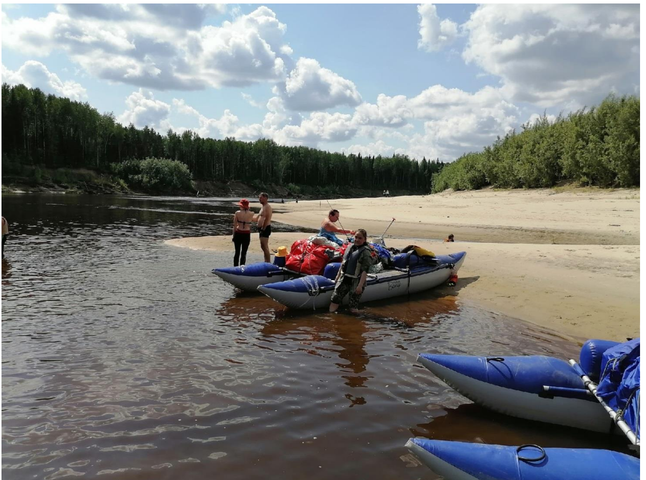
Фото 4. Во второй половине лета, когда вода в реке спадает, открываются обширные песчаные косы, на которых можно отдохнуть, пообедать или встать на ночевку.