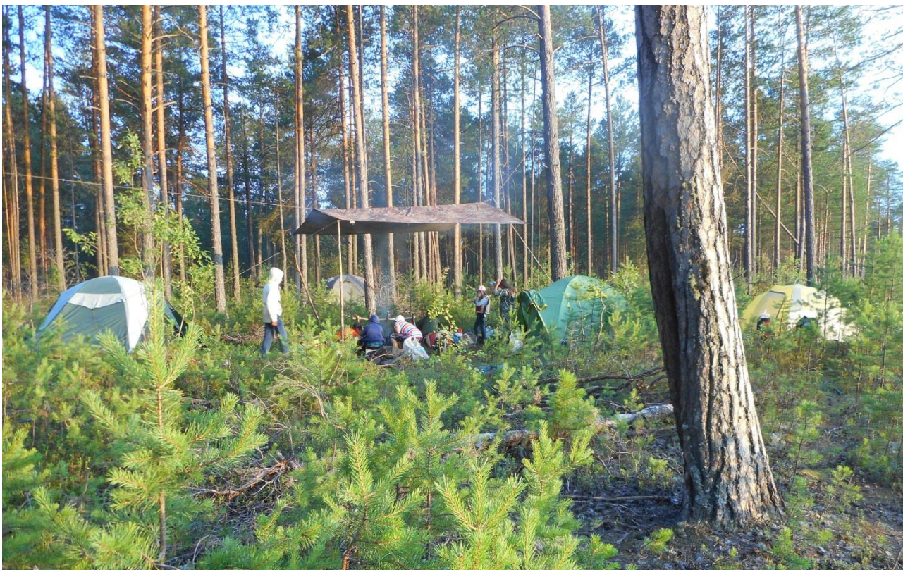
Фото 9. Стоянка на яру в урочище Пегишево.