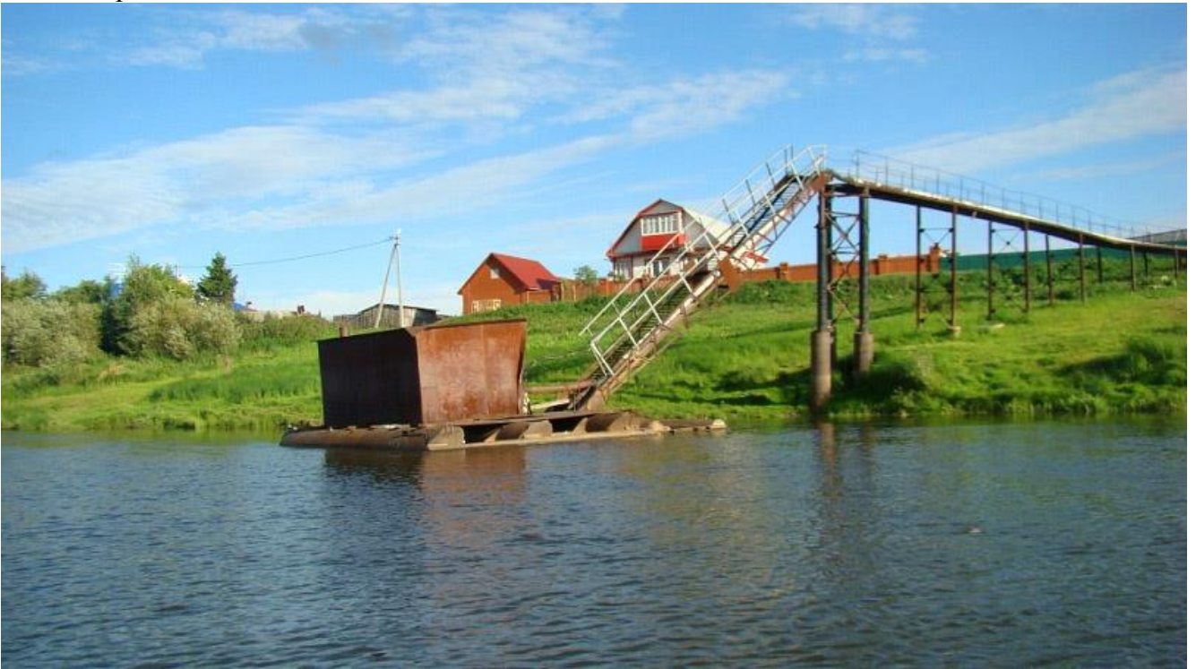
Рядом с лагерем «Алые паруса»