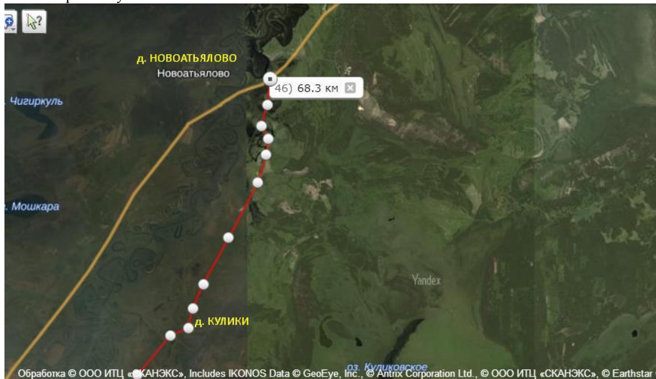
Схема отрезка Новоатъялово - Староалександровка